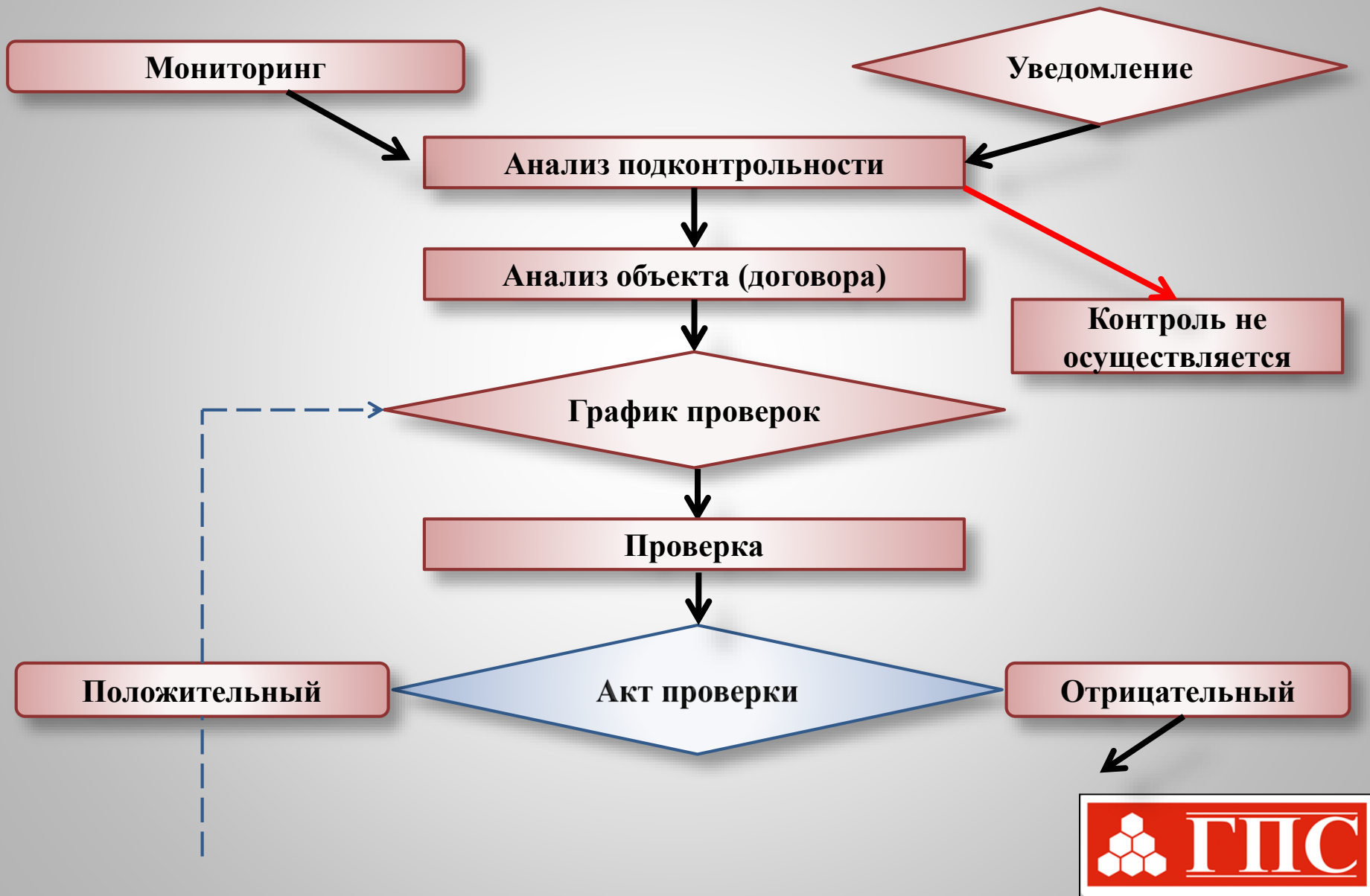
СХЕМА ОСУЩЕСТВЛЕНИЯ КОНТРОЛЯ